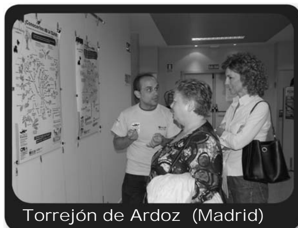
Torrejón de Ardoz (Madrid)

Te enviaremos por correo electrónico la disponibilidad de la exposición. El préstamo está supeditado a las fechas disponibles.