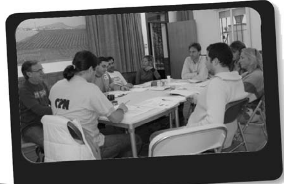
Nuestros compañeros de DEMA hicieron de excelentes anfitriones

Una decena, de representantes de diversas asociaciones CPN de toda España se reunieron en el Centro de Educación Ambiental "Las Aguas" de Almendralejo, entre el 10 y 12 de octubre.