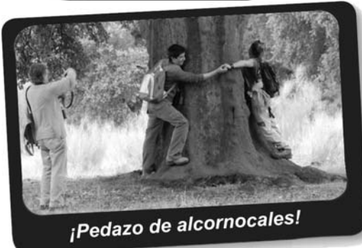
¡Pedazo de alcornoques!