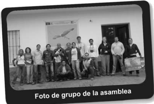
Foto de grupo de la asamblea